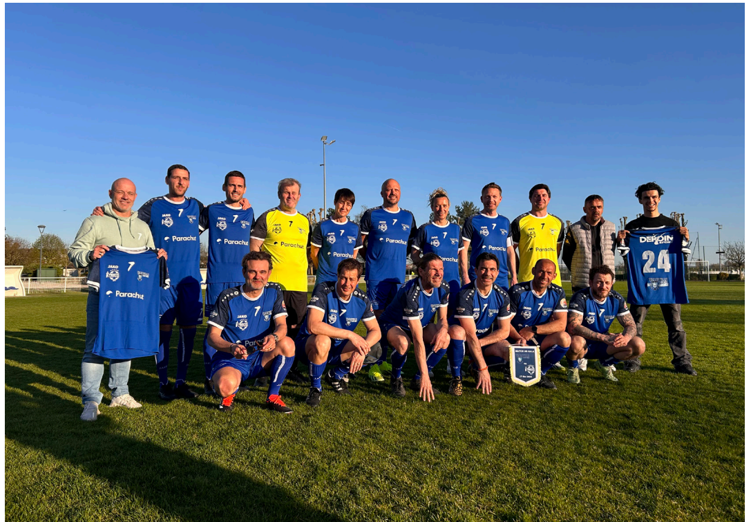
La Team Trouville à l'entraînement.