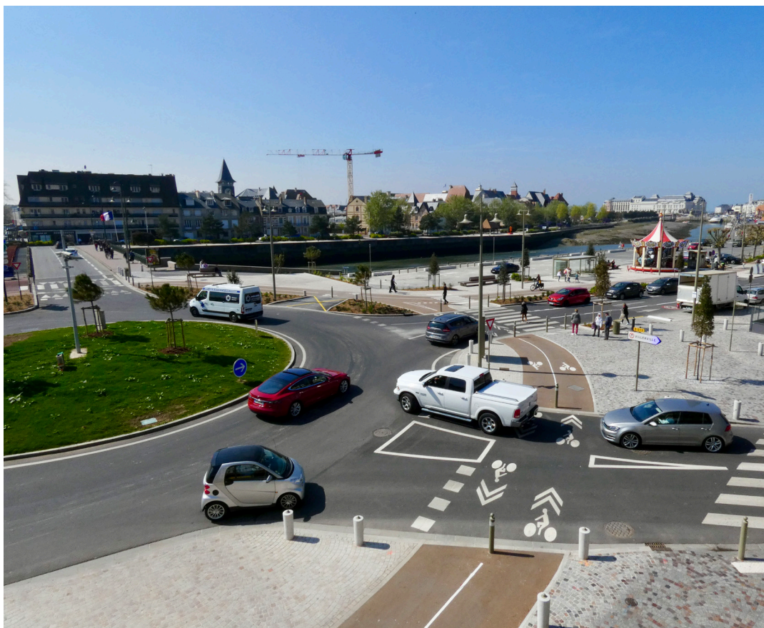
Vue de l'hôtel de l'Estran.

Trouville peut s'enorgueillir d'offrir un visage plus attrayant et respectueux de l'environnement.