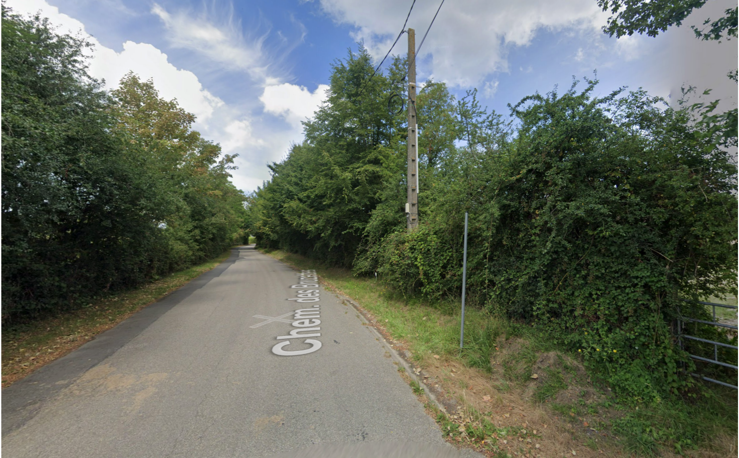
PA7b - Vue de loin depuis le chemin des Bruzettes