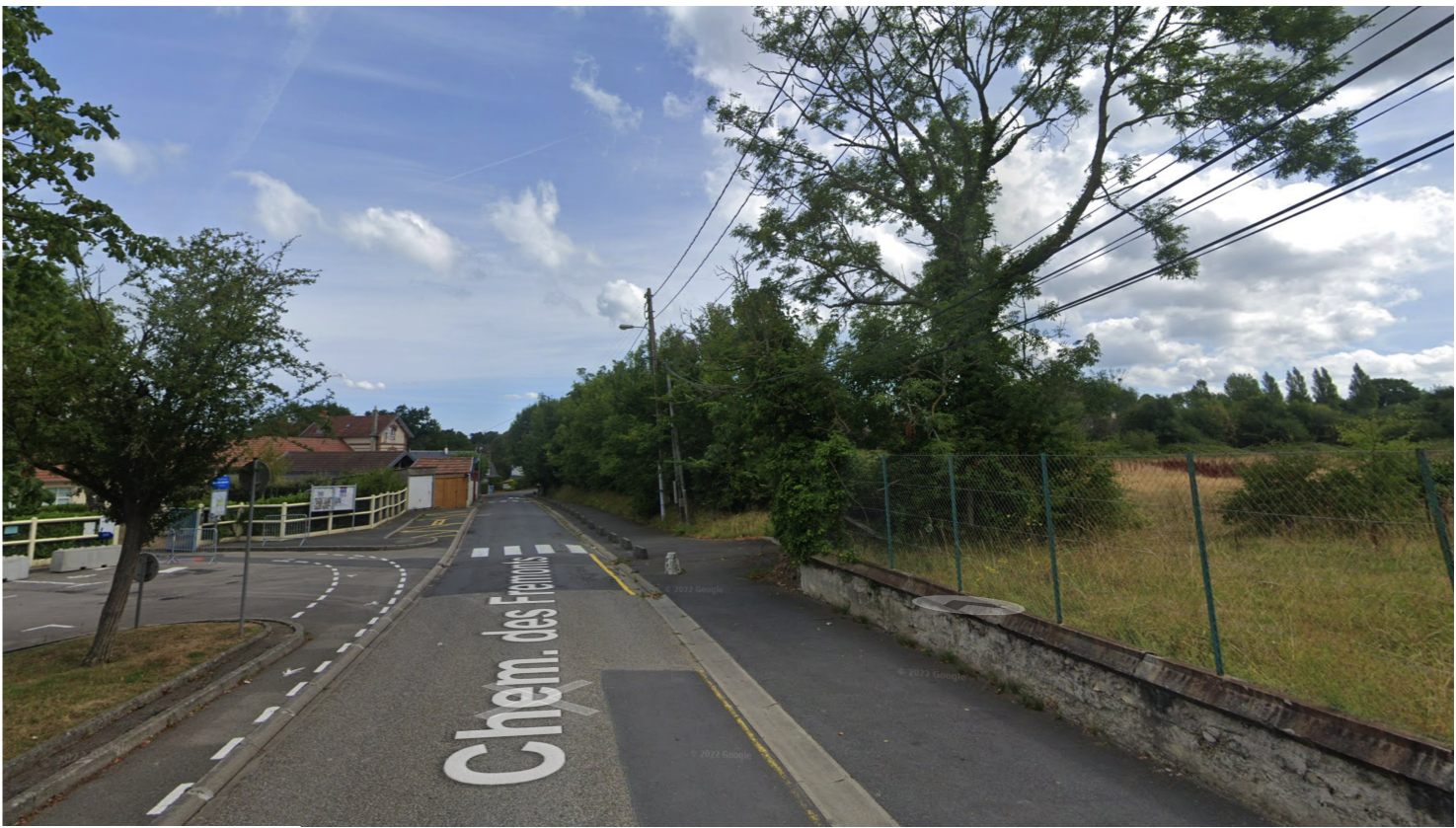
PA7a - Vue de loin depuis le chemin des Frémonts