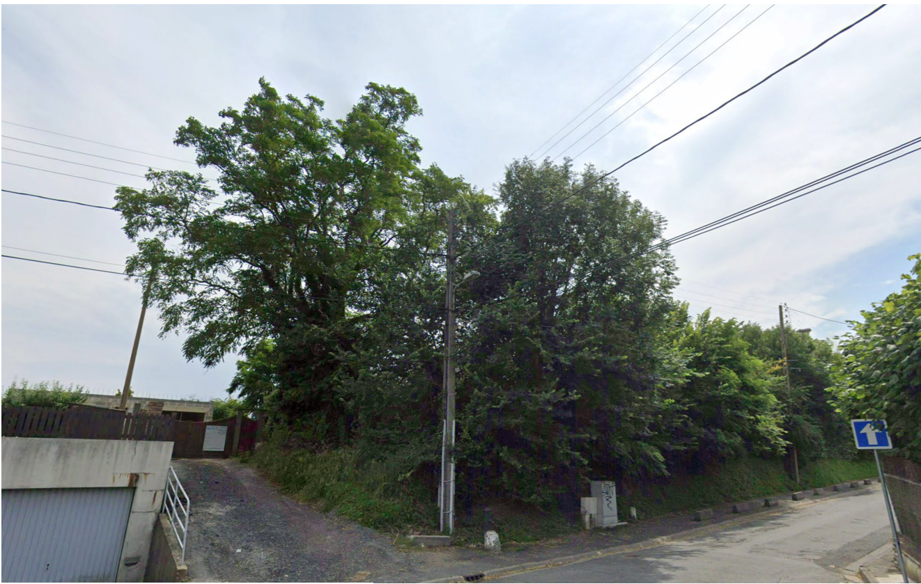
PA6 - Vue de près depuis l'intersection entre le chemin des merles, l'ancienne route de Villerville et le chemin des Frémonts