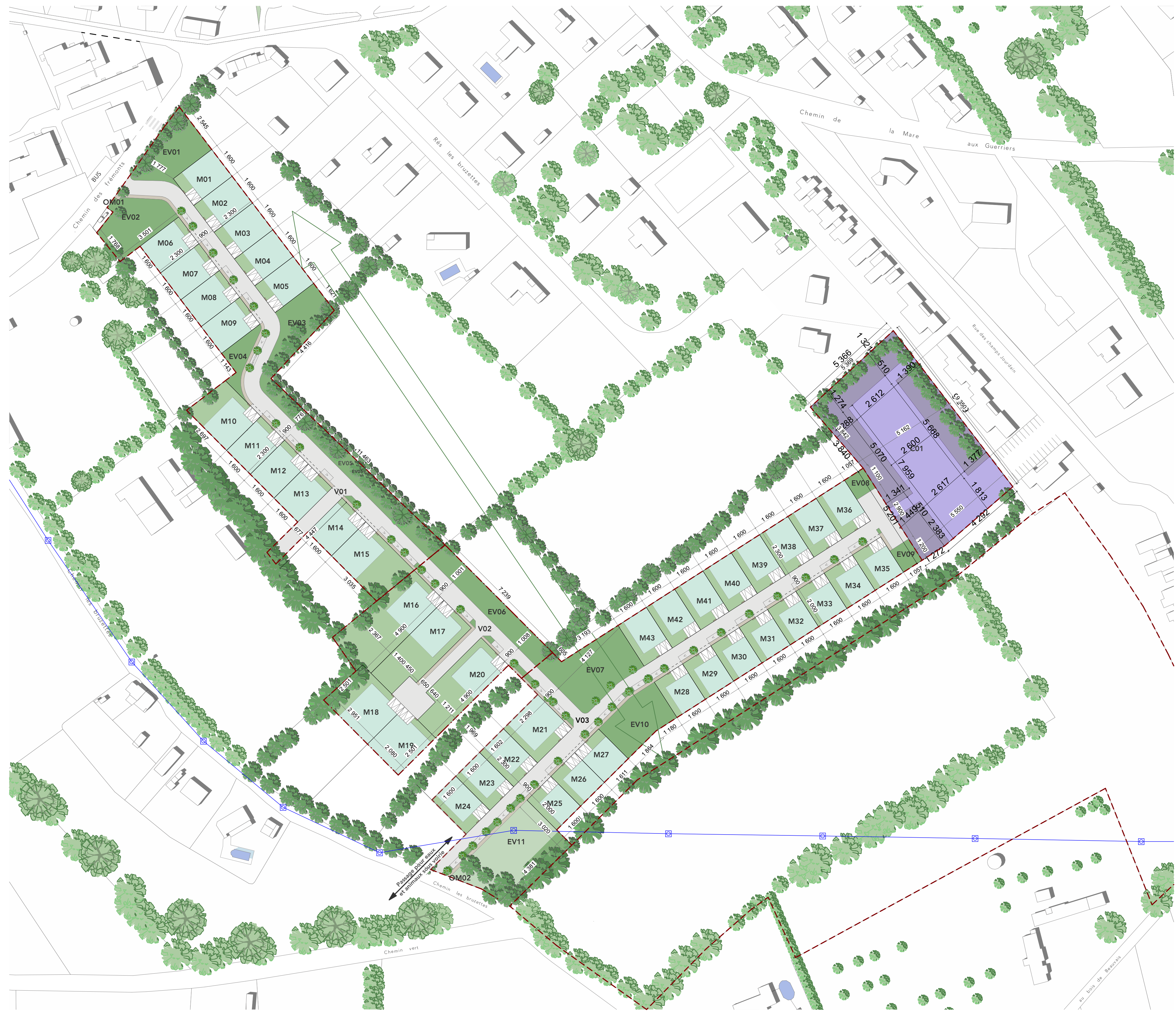
Plan masse - 1000°

Pièces complémentaires au PA 014 715 23 R006