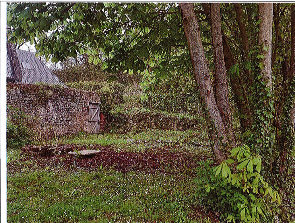
Fichier : 20240415_141109.jpg Remonté le : 15/04/2024 15:04