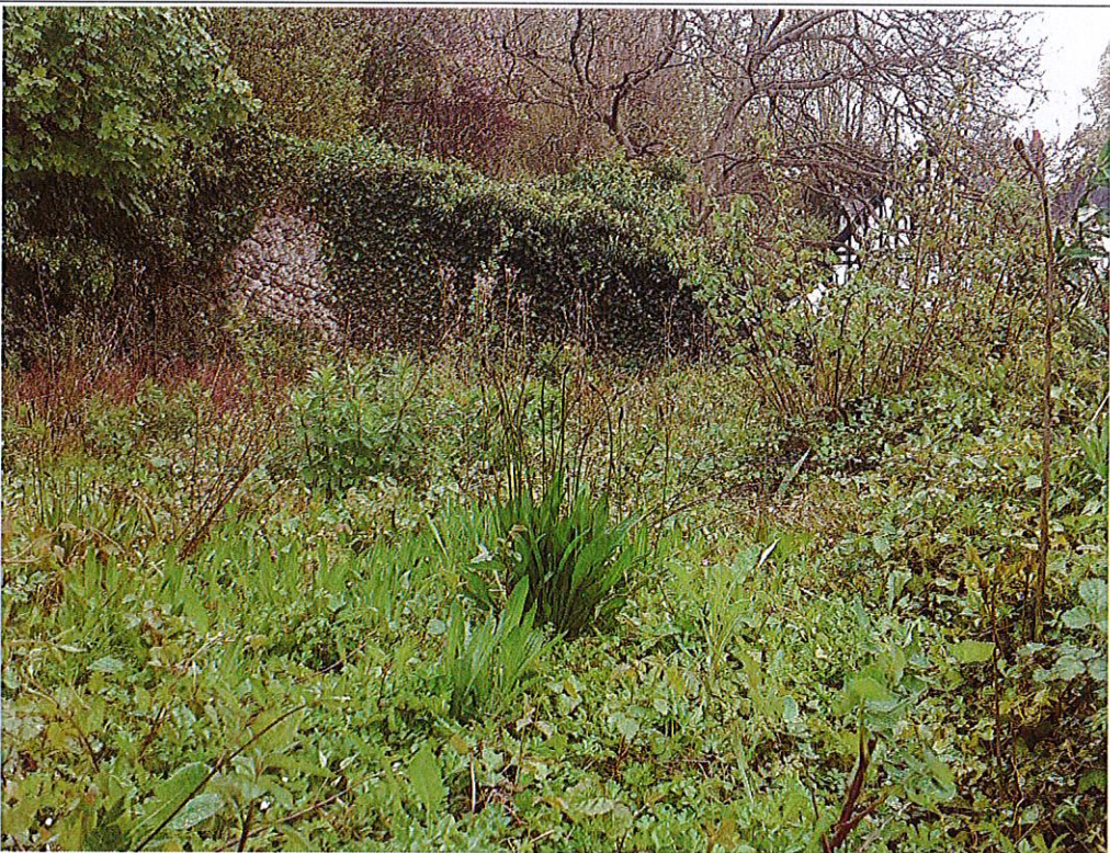
Fichier : 20240415_141129.jpg Remonté le : 15/04/2024 15:05