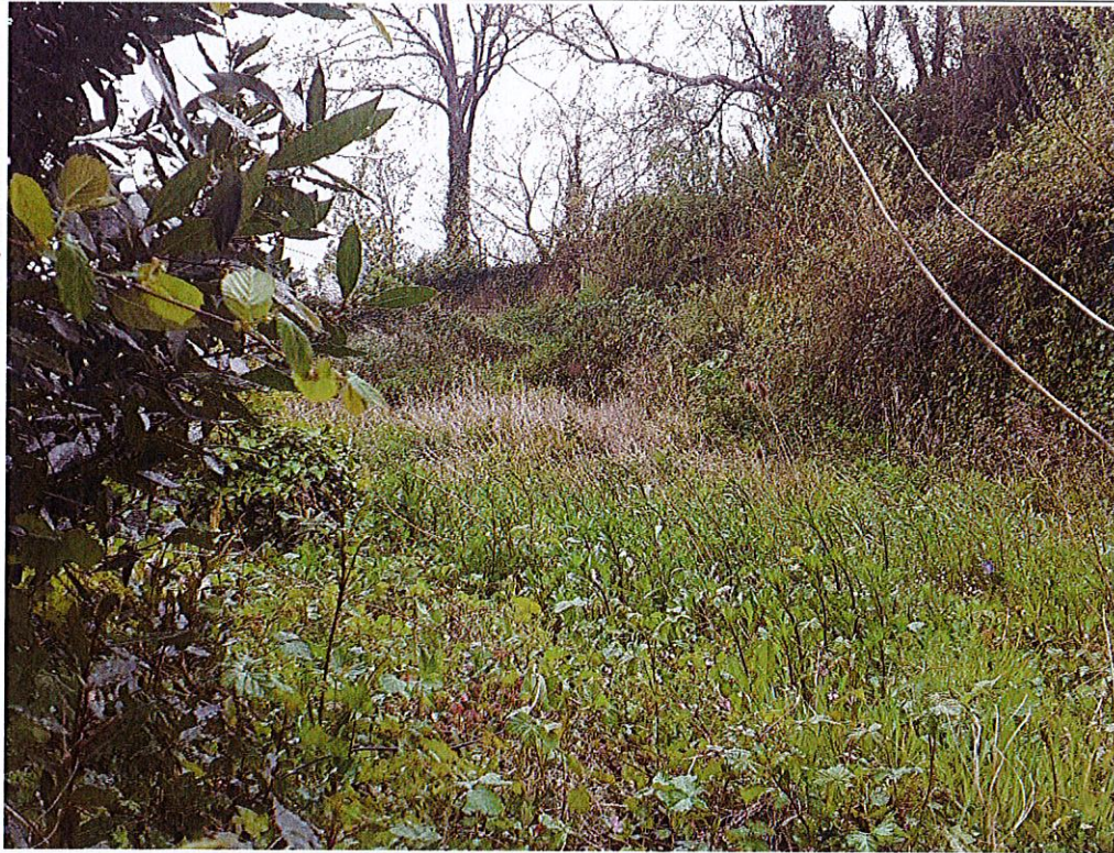
Fichier : 20240415_141126.jpg Remonté le : 15/04/2024 15:04