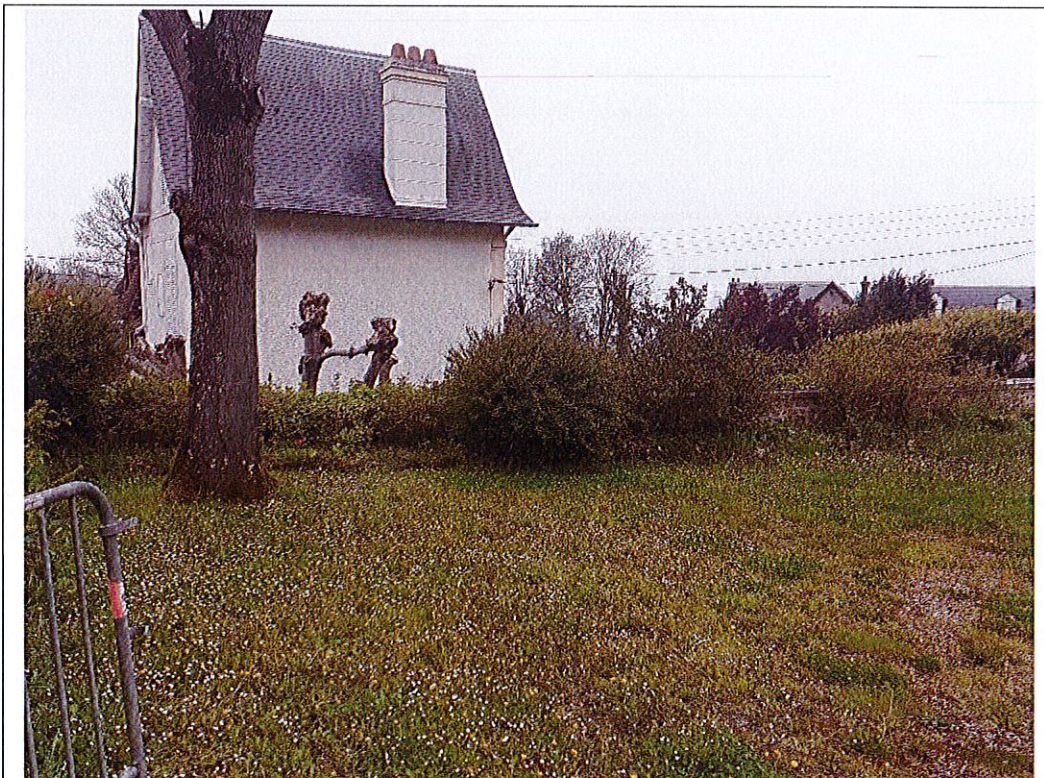
Fichier : 20240415_141024.jpg Remonté le : 15/04/2024 15:03