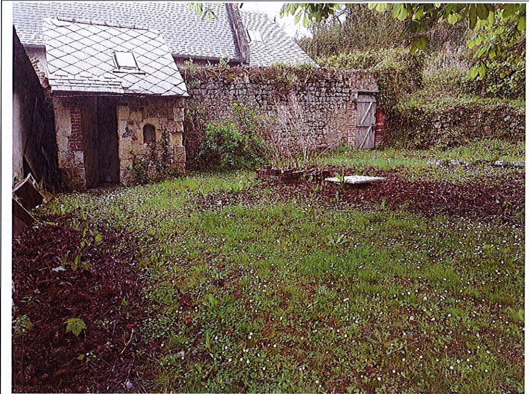
Fichier : 20240415_141104.jpg Remonté le : 15/04/2024 15:04