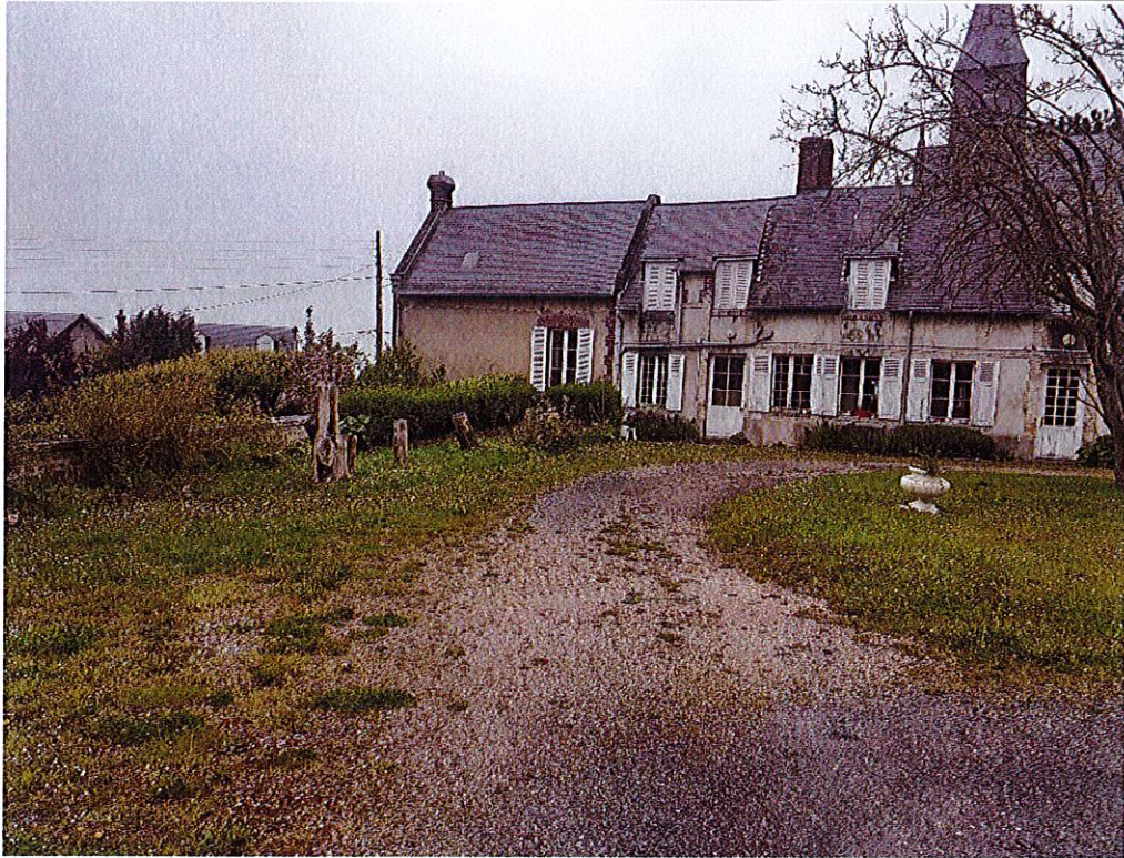
Fichier : 20240415_141023.jpg Remonté le : 15/04/2024 15:03